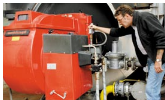
Insgesamt sind drei Erdgas-Anlagen mit einer Leistung von über 10 Megawatt installiert.